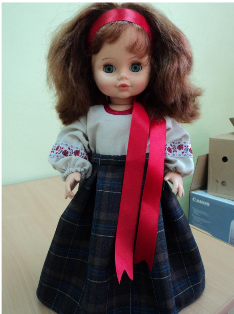
Повседневный наряд девушки Рязанской области. Льняное платье – туника, юбка, лента-ободок в волосах, холщевые онучи, лычаки (лапти).