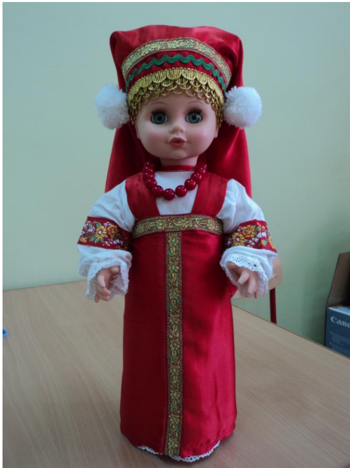
Свадебный наряд девушки Рязанской области. На голове Кика рогатая (кичка), красный шелковый сарафан с орнаментом, «Плакательная» венчальная рубаха с орнаментом-оберегом и вышивкой по подолу и рукавам, бусы-косники.