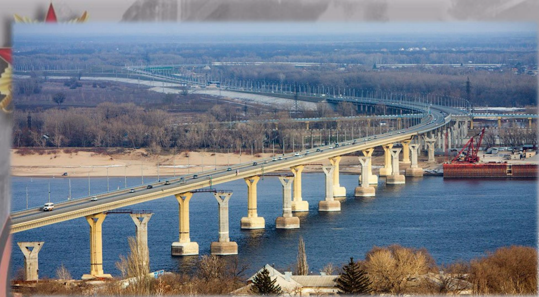
Мост через Волгу